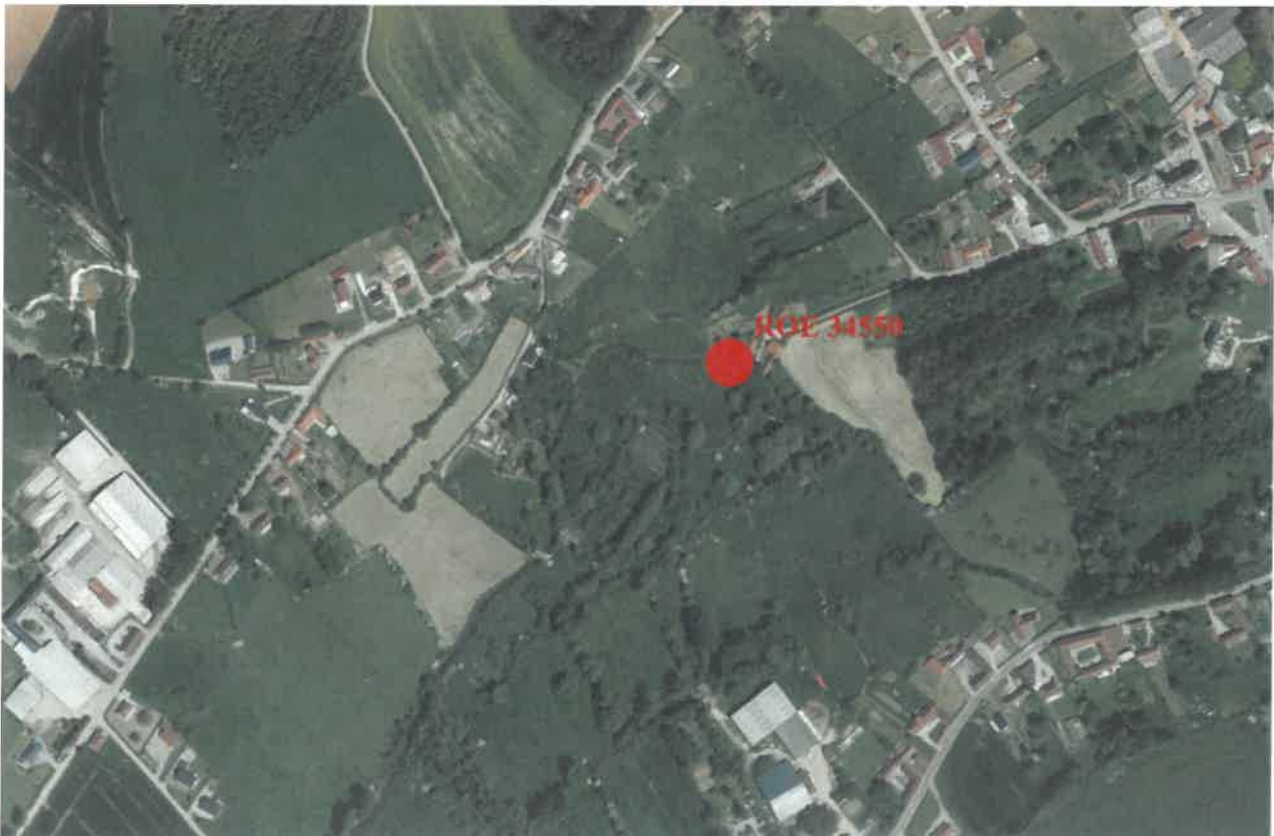
Situation du site