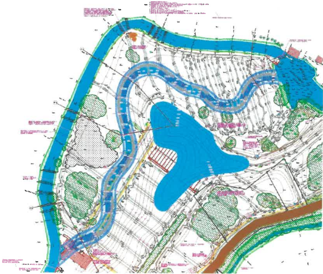
Bras de contournement de l'ouvrage hydraulique